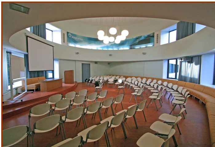
Конференц-зал на 130 мест, оснащенный современным проекционным оборудованием.

Компания "АЛЕКТА" располагает широкими возможностями для проведения конференций, семинаров и презентаций, обучения.