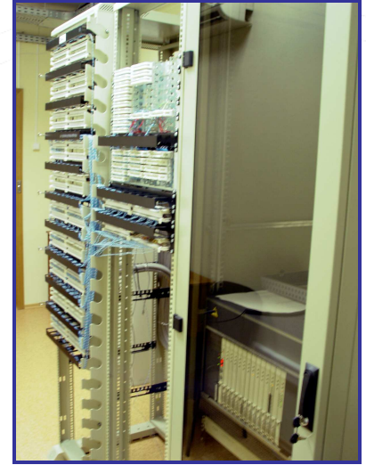
АТС AVAYA S8500 на 2000 номеров.