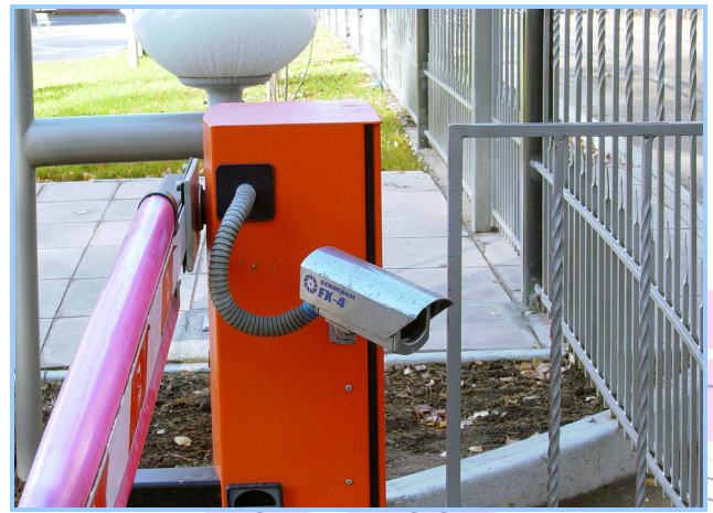
Более 30 камер наружного и внутреннего наблюдения.