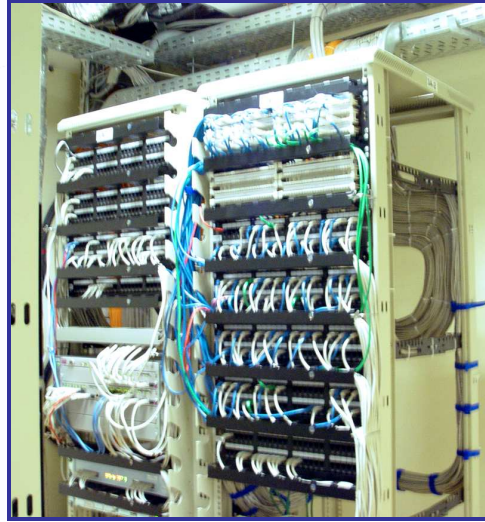
Центральный коммуникационный узел СКС.