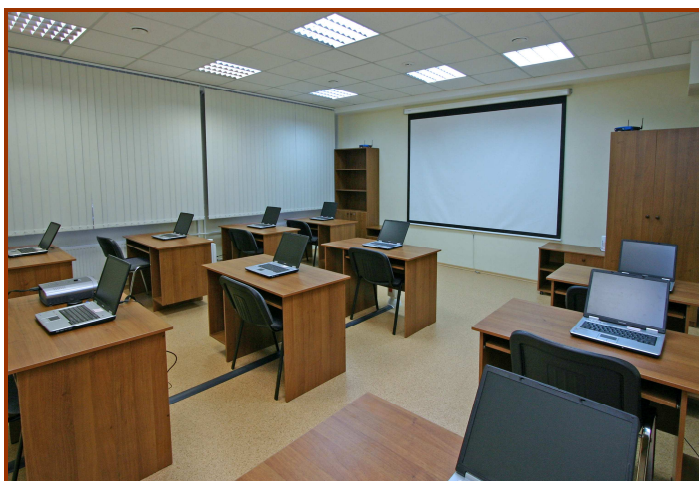
Два учебных класса на 10 мест каждый.