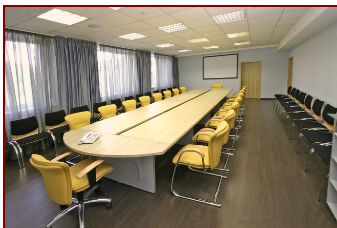
Зал для заседаний на 50 мест, оснащенный переносным проекционным оборудованием.