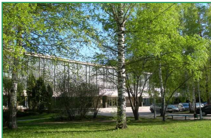
Дом ученых Сибирского Отделения Российской Академии Наук.