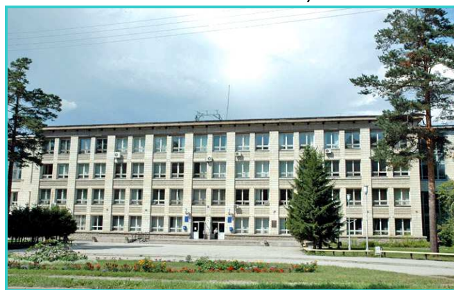
Новосибирский государственный университет.