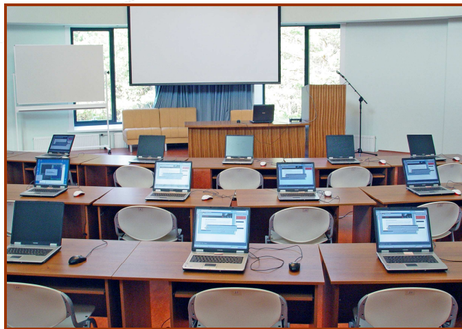
Конференц-зал трансформируется в учебный класс на 20 мест.