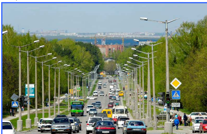
Проспект им. академика Лаврентьева.

Академгородок летом утопает в зелени, зимой укутан в снега. В двух шагах от высоких зданий – настоящий реликтовый лес, в котором можно встретить белку и покормить её с руки. Море – Обское водохранилище – в десяти минутах ходьбы от городской зоны.