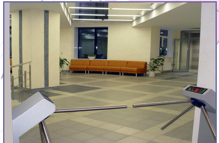
Система контроля и управления доступом.