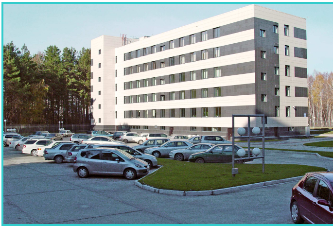
Охраняемая парковка на 120 мест.