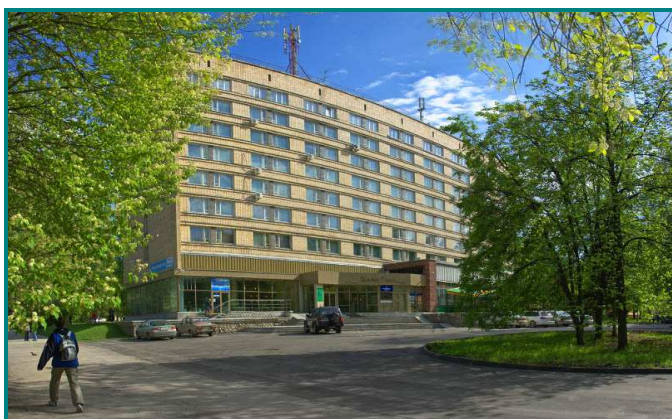
Гостиница "Золотая долина".